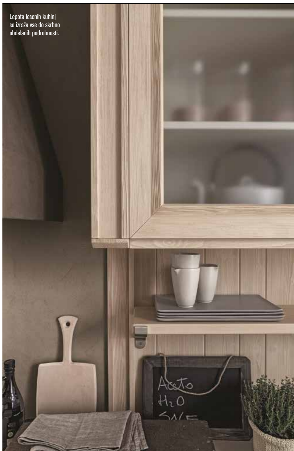
Lepota lesenih kuhinj se izraža vse do skrbno obdelanih podrobnosti.