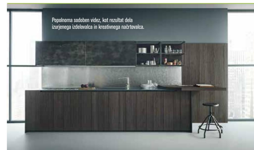
Popolnoma sodoben videz, kot rezultat dela izurjenega izdelovalca in kreativnega načrtovalca.